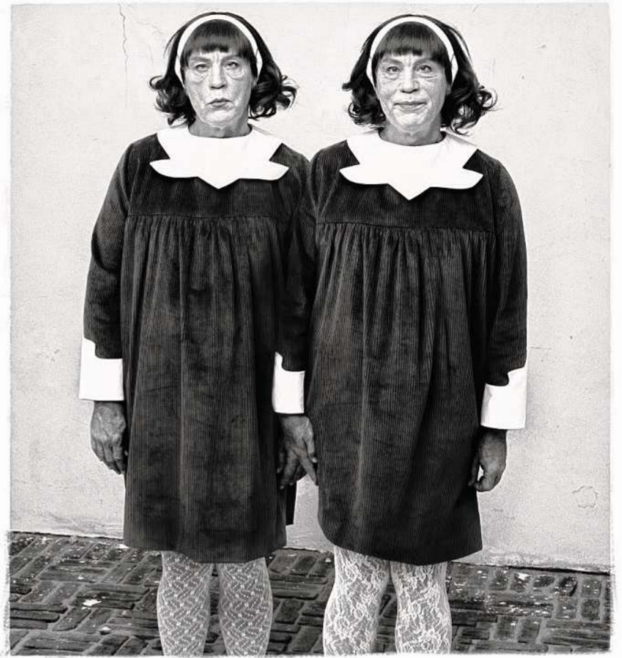
Diane Arbus: Identical Twins, Roselle, New Jersey (1967)